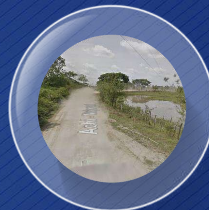
II. Proyecto Invias Reactivación 2.0 $1,4 billones