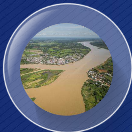
I. Proyecto La Mojana $1,8 billones