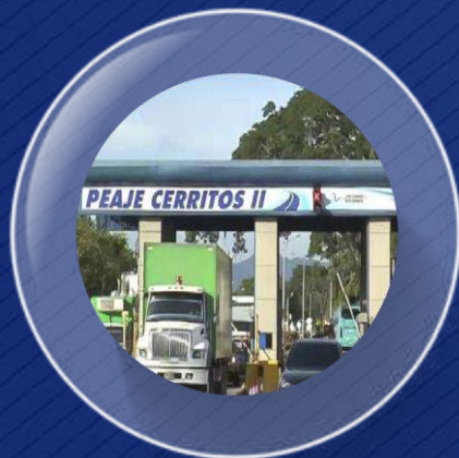
III. Proyecto Invias “Asociación Pública – Pública” Samán - $1,1 billones Idesán - $1 billón