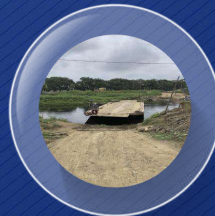
IV. Proyecto Invias Reactivación 2.0 Entidades Territoriales $1 billón